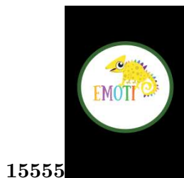
Figure 2: Bibliografía 1 .1 3 5 5 5 5