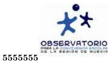
Figure 3: 1 3 5 ” 5 5 5 5 3 5